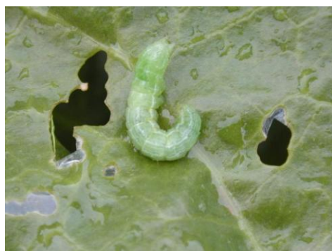
Dégâts de noctuelles défoliatrices Avec chenille de grande taille et perforations à proximité.