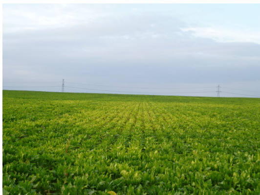
Parcelle fortement touchée

Des zones moins développées avec un feuillage réduit flétrissant rapidement aux heures chaudes de la journée carencées en magnésie sont observées dans des parcelles à proximité de zones déjà reconnues touchées par ce nématode. L'extension du parasite se poursuit et de nouveaux cas sont identifiés chaque semaine sur l'ensemble des sucreries du Sud de Paris . L'introduction de la culture du Colza dans la rotation, mais surtout l'impossibilité de destruction des repousses à moins de quatre semaines va contribuer encore un peu plus rapidement à l'extension du parasite.