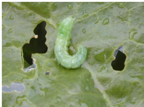
Chenille de grande taille avec perforations à proximité.

Les dégâts de noctuelles défoliatrices sont plus fréquents.